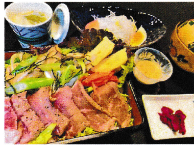
ステーキ重セット