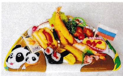
お子様ランチプレート