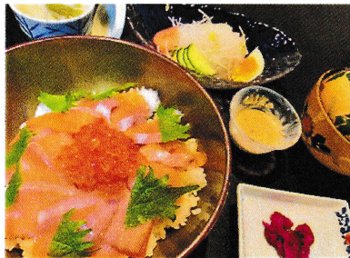
サーモン親子丼セット