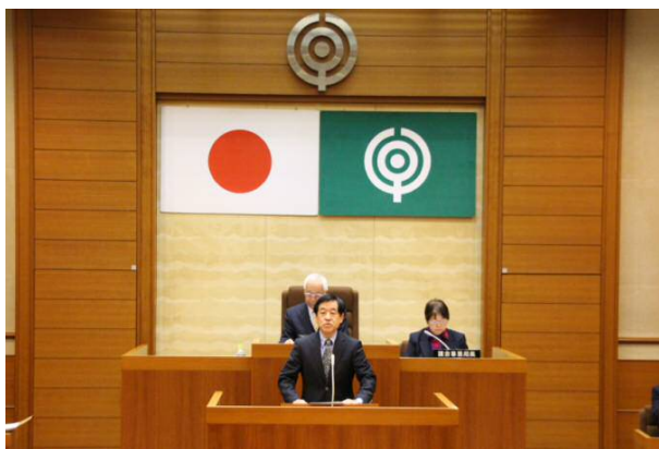
町議会で施政方針演説