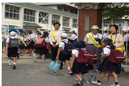
あいさつ運動（早小）