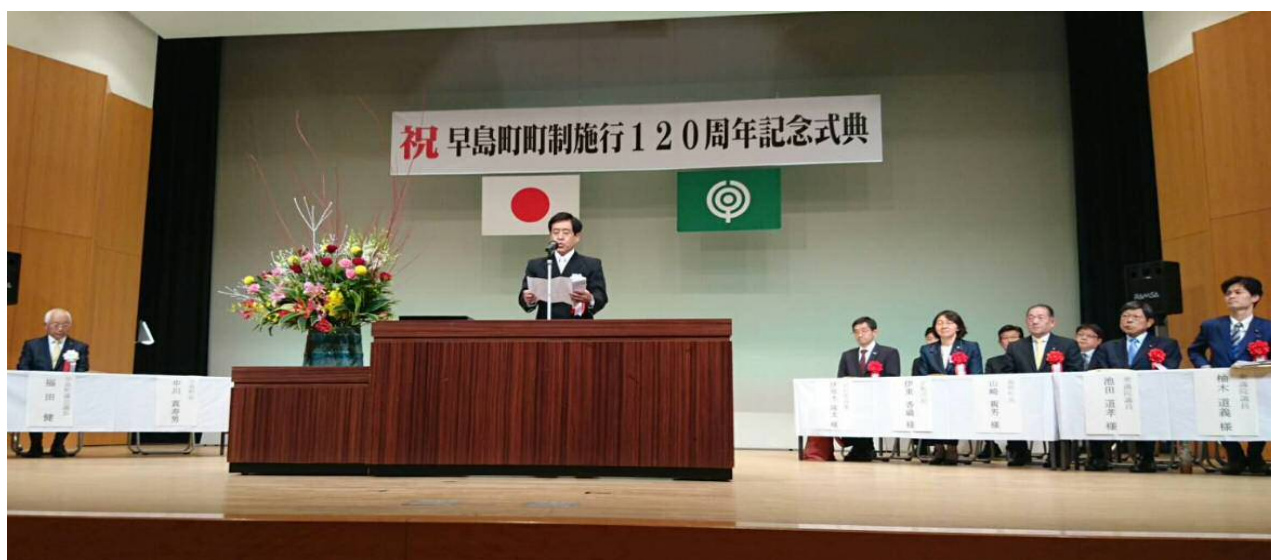
町制施行120周年記念式典