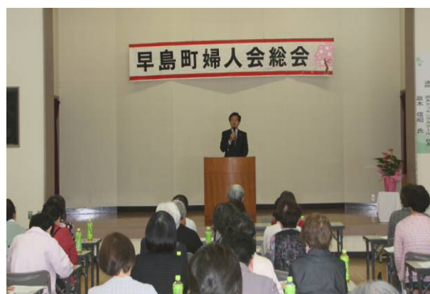
婦人会総会で挨拶