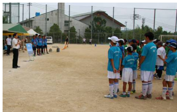
ファジアーノ岡山によるサッカー教室