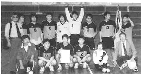
第54回県民体育大会男子優勝スナップ

また、平成22年（2010年）開催予定の沖縄 インターハイに向けて市協会では、強化普及部 を設置し、市内から多くの子供達が選手として 活躍できるようさらに、ハンドボールというス ポーツを通して全国、世界で活躍できる選手 の育成及び競技力向上を目指すと共に社会に 貢献できる多くのすばらしい人材育成に精進 していく所存である。