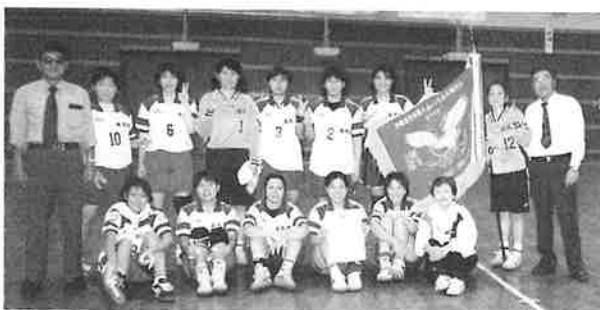
第54回県民体育大会女子優勝スナップ