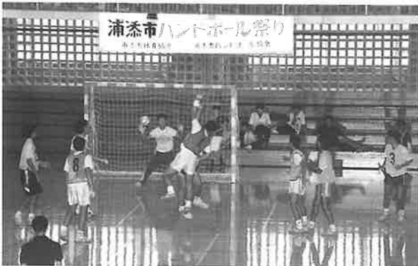
浦添市ハンドボールまつり

てもらうためパート別に試合を組むなどして工夫をこらしハンドボールを楽しむ事を目的として運営をしている。