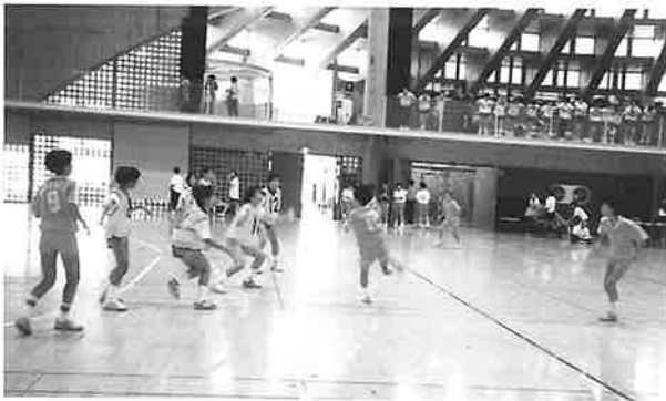
小学生ハンドボール