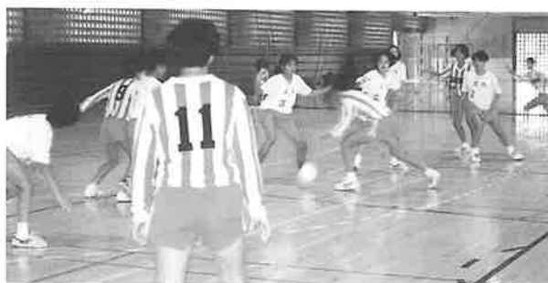
中学生ハンドボール大会の様子