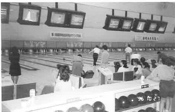
第4回自治会対抗ボウリング大会の様子

平成8年度 優勝…伊祖自治会 2位…前田自治会 3位…宮城自治会 平成9年度 優勝…前田自治会 2位…伊祖自治会 3位…宮城自治会 平成10年度 優勝…前田自治会 2位…伊祖自治会 3位…経塚自治会 平成11年度 優勝…前田自治会 2位…伊祖自治会 3位…宮城自治会 平成12年度 優勝…伊祖自治会 2位…前田自治会 3位…宮城自治会