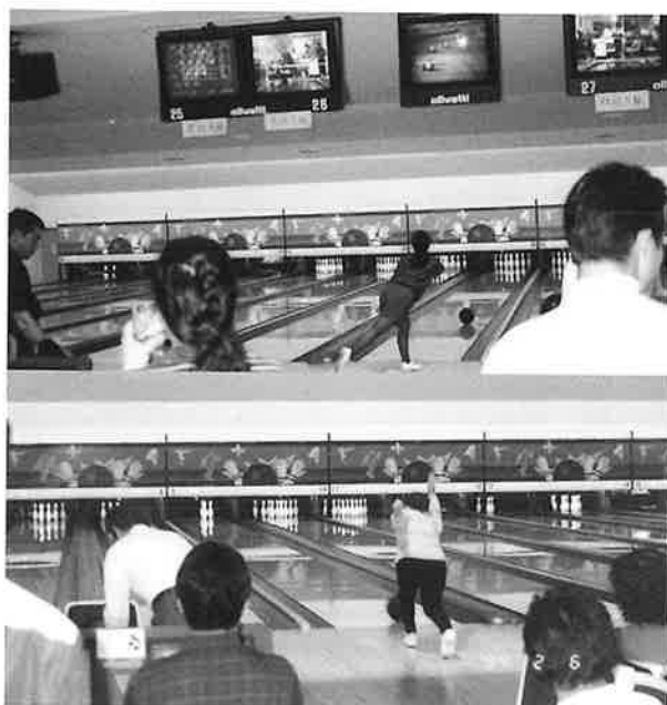
平成6年の自治会対抗ボウリング大会から

市体育協会主催による自治会対抗ボウリング大会は平成5年度からスタートし、平成14年度には第10回の記念大会を開催した。競技関係者から組織化を図りながらより良い運営をとる機運が高まり、平成12年（2000年）4月16日には念願の協会設立となった。