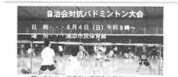
自治会対抗バドミントン大会