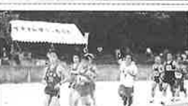
自治会対抗陸上競技大会

編集後記 (Editorial Note) regarding the badminton tournament.