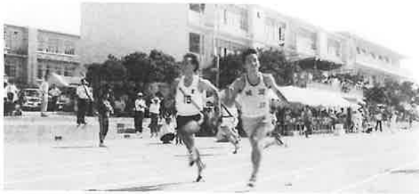
各字対抗陸上競技大会 100m 仲西中学校にて/1971年（昭和46年）頃