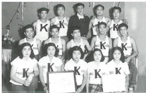
1952年10月12日浦添村青年会主催 第6回 各字対抗陸上競技大会 優勝記念写真