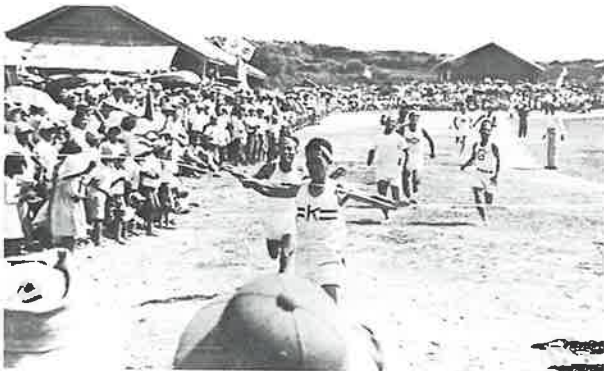
仲西小学校グラウンドでの浦添村内各字対抗陸上競技大会 1950年代（昭和25年）