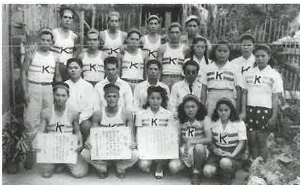
1948年10月10日浦添村青年会主催第2回各字対抗陸上競技大会 優勝記念写真