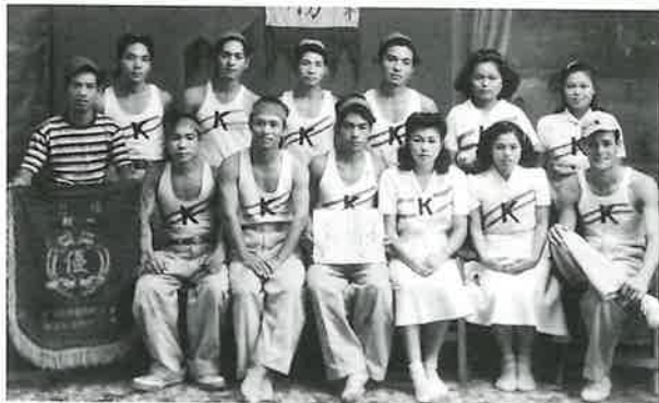
1949年10月9日浦添村青年会主催第3回各字対抗陸上競技大会 優勝記念写真