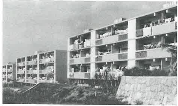
完成した内間市営住宅