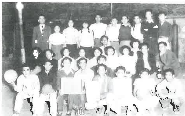
浦添村青年会主催各字対抗籠球優勝記念 1954年（昭和29年）