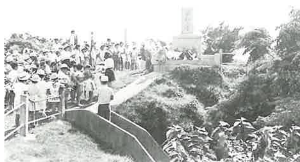
村慰霊祭 浦和の塔は27年9月建立