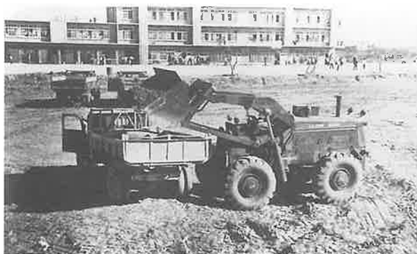
米軍の協力によるグラウンド整地作業