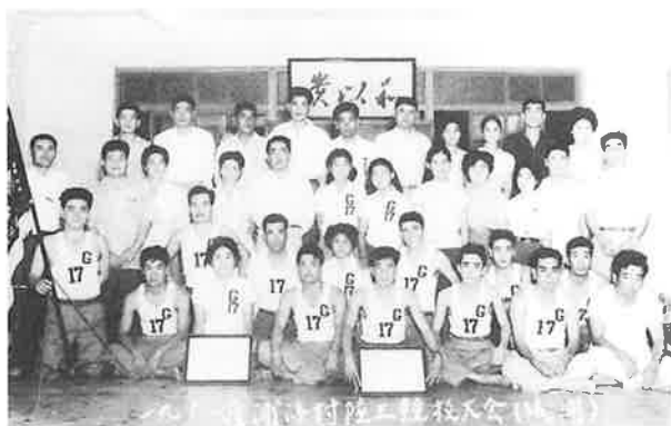
浦添村陸上競技大会 城間チーム 1961年（昭和36年）