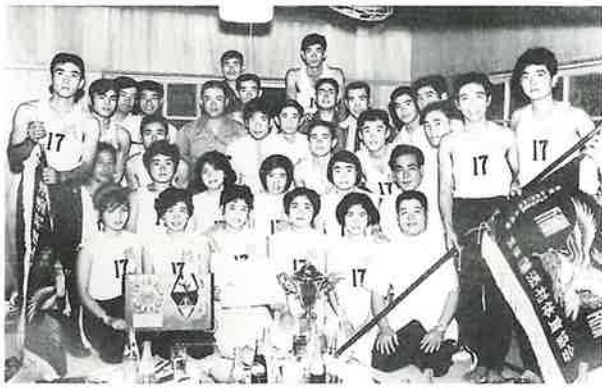
第14回村内各字対抗陸上競技大会総合優勝記念 1967年（昭和42年）10月8日